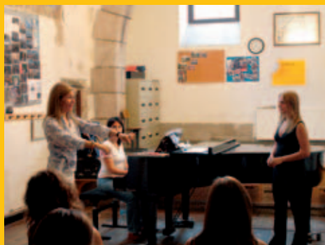
➤ XXII Festival de Música de Zumaia