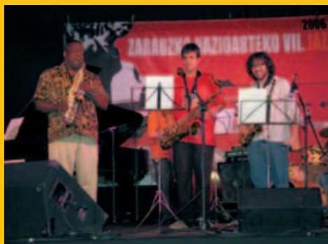
➤ VII Seminario de Jazz de Zarautz

el evento participando o bien como alumnos o bien como músicos de apoyo a diferentes clases en calidad de pianistas, bajistas o baterías acompañantes de las clases de voz, acordeón o cuerda. La experiencia, como digo, ha vuelto a ser tan gratificante como todas las vividas desde que Musikene participa en este Seminario por la exitosa mezcla que supone tener entre nosotros a grandes estrellas del Jazz impartiendo clases magistrales al lado de personas que se acercan por primera vez al Jazz y reciben allí una información tan amena como precisa que les llevará, quién sabe, en un futuro, a convertirse en profesionales de este estilo musical.